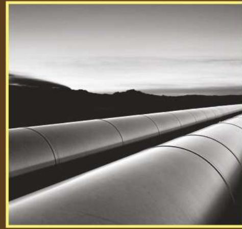
DRINAGE LINE (WITHOUT INDUSTRIAL WASTE)